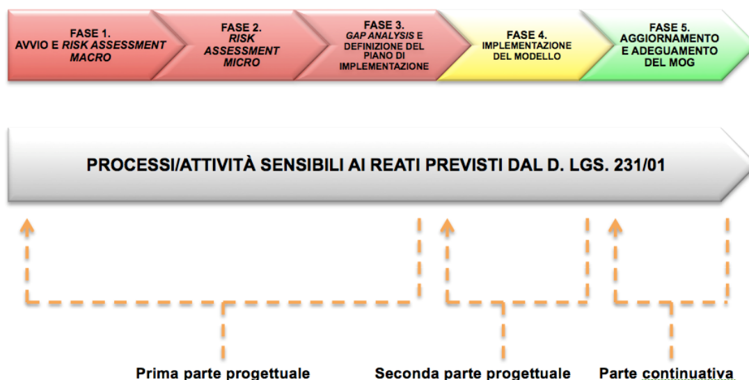
Figura n. 1: Modello di organizzazione, gestione e controllo di Bedeschi Salumi s.r.l.

Il progetto di predisposizione e sviluppo del MOG si è concluso nel marzo 2020 e si è articolato nelle seguenti fasi.